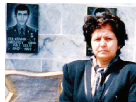
dılırdı. Şirin qısa müddətdə silah tapıb ala bildi, əsgərləri geyimlərlə tomin etdi...